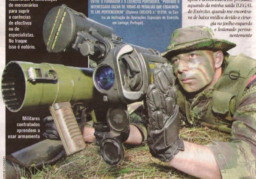
Militares contratados aprendem a usar armamento

Cada vez mais os estados, como é o caso dos Estados Unidos da América, recorrerem à contratação de mercenários para suprir a carências de efectivos ou de especialistas. No Iraque isso é notório.